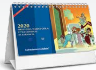
Calendario da tavolo

CON GLI OMAGGI VENDIBILI DIMEZZI I COSTI!! SCOPRI L'OFFERTA