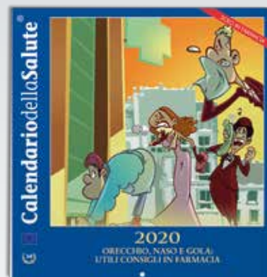
Calendario compatto da parete